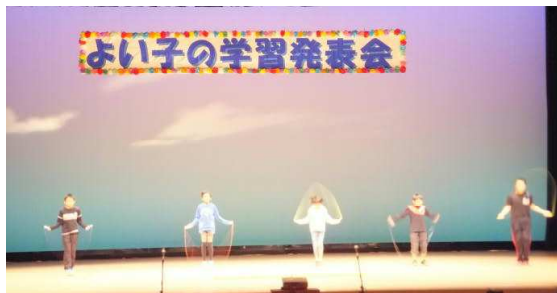
シンクロ!?なわとび

11月27日(金)に市民会館で、市内の特別支援学級合同のよい子の学習発表会・作品展が行われました。