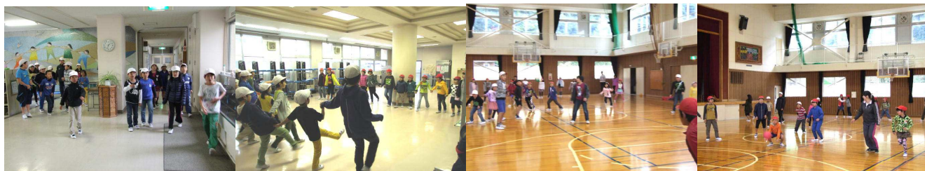
だるまさんがころんだ!

11月26日(木)に、なかよし班の共遊が行われました。普段は、校庭と体育館で行いますが、あいにくの雨で、校庭を使う班は、校舎内で遊びました。