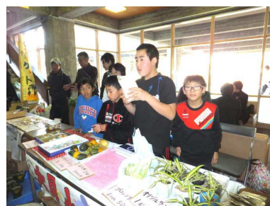
お店もがんばりました

すみれ学級・マナビー学級の子どもたちは、舞台での発表と特設のお店で作品の販売をしました。舞台では、暗唱した文章や得意ななわとび、マット運動の演技を発表しました。練習の成果を十分に発揮し、