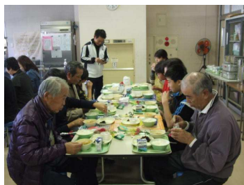
いつもありがとうございます

12月9日(水)に、見守りボランティアの皆様との3学期の予定を決める話し合いが開かれました。話し合いの後、お礼の会を兼ねて、5・6年生との会食が行われました。子どもたちからは、お礼の言葉と心ばかりですがお礼の品をお贈りし、感謝の気持ちをお伝えしました。見守りボランティアの皆様には、毎日、子どもたちの安全のためにお世話になっております。これから寒さが厳しくなって参りますので、健康にご留意され、3学期もよろしくお願ひいたします。