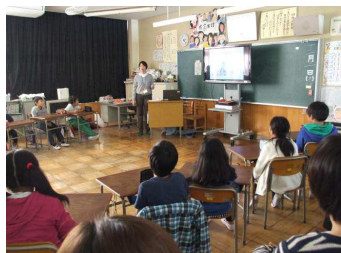
認知症サポーター育成講座